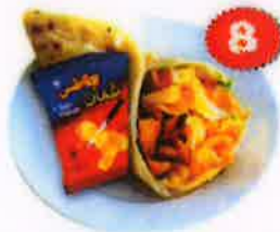
CHIPS OMAN SANDWICH